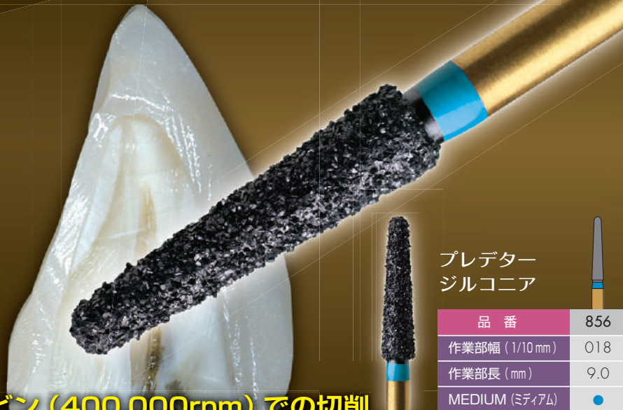
プレデター ジルコニア