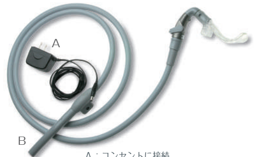
A：コンセントに接続

※マウスピースは「イソライト・プラス」「イソドライ」共通です。 ※マウスピースは単回使用です。