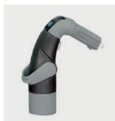
LED光源内蔵のコントロールヘッド