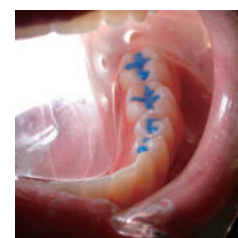
明るく照らし出された術野