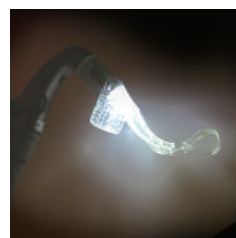
マウスピースを通して光が拡散