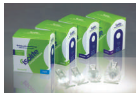
※マウスピースは単回使用です。