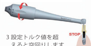
3 設定トルク値を超えると空回りします

記載されている価格に消費税は含まれません。また、商品の内容・価格・仕様・デザイン等を予告なく変更する場合があります。無断転載禁止。