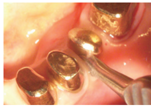
歯周ポケットに挿入し、歯周靭帯切断