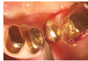
歯牙に沿わせて歯周靭帯を切り進める