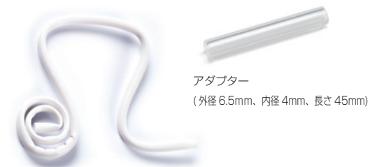
アダプター (外径6.5mm、内径4mm、長さ45mm)