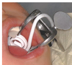
開口器使用時に使用