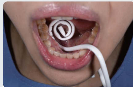
自由に變形することが可能

感染対策には十分に力を注いでいることをアピールするためにも、このようなディスポーザブルの製品を患者の目前で装着し、使用後は廃棄している姿を見せることが、医療現場での真のサービスと言えるのではないだろうか。