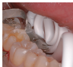
舌の保護をしながらクランプと使用