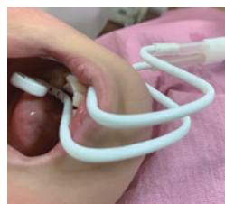
根管治療時に使用