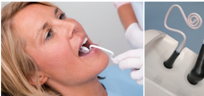
患者さんの骨格や施術箇所に合わせて形が調節でき また顎に固定できるので安定した使用が可能