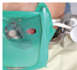
ラバーダムと併用