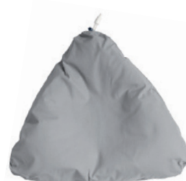
カバー / グレー