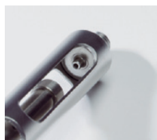
注射筒内側の突起