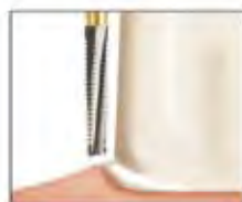
ショルダー / FIG No.847

* 本記事は、個人の感想であり、効能・効果を保証するものではありません。ご使用の際は、添付文書等をよくお読みください。