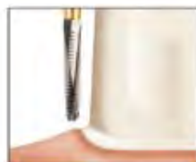
シャンファー / FIG No.856