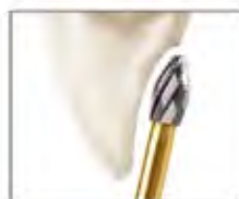
舌側・咬合面 / FIG No.379