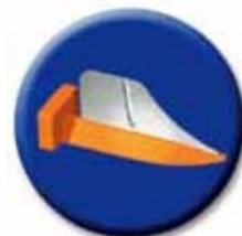
使用後の状態例 プレパレーション時に隣接歯を傷つけるのを防ぎます