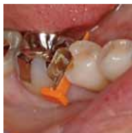
形成時、隣接歯を傷つける心配がありません