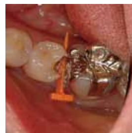
フェンダーウェッジ・プロを抜き取って修復に移ります