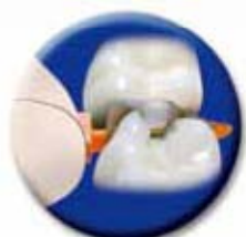
ウェッジを差し込む