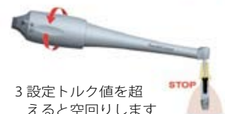
3 設定トルク値を超えると空回りします